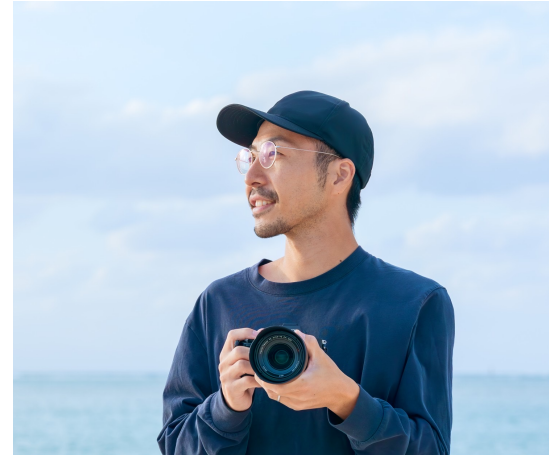
カメラマン はじめ